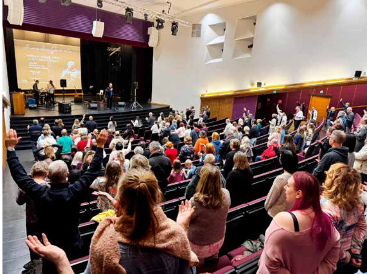
Sampolan auditorioon saapui ilahduttavasti yleisöä.

- Kävelin ulos oikeudesta ilman rikosrekisteriä! Eikö tämä ole juuri sitä, mitä Jeesus on tehnyt puolestamme? Meille oli luettu lain perusteella tuomio, mutta Jeesus tuli ja maksoi kaiken. Tämä