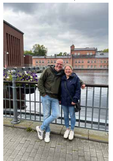
Mooseja innostaa kohtaamiset eri kulttuureista tulevien ihmisten kanssa.