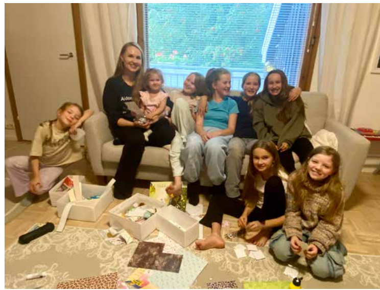
Suosalon kotisolussa on iloa ja elämää.

– ”Sallikaa lasten tulla minun tyköni, älkääkä estäkö heitä, sillä senkaltaisten on Jumalan valtakunta” (Matt.10:14).