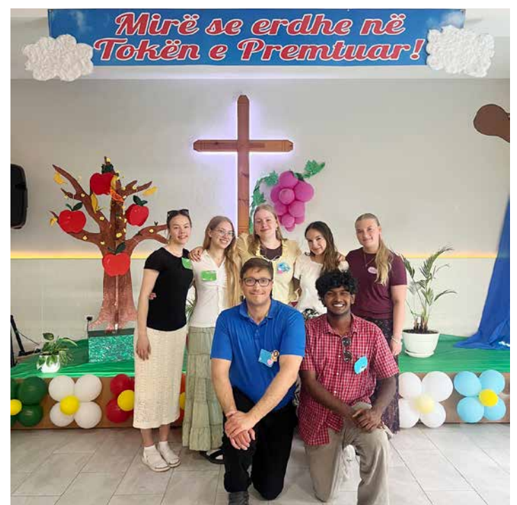
Tiimimme Fier-nimisen kaupungin seurakunnassa.