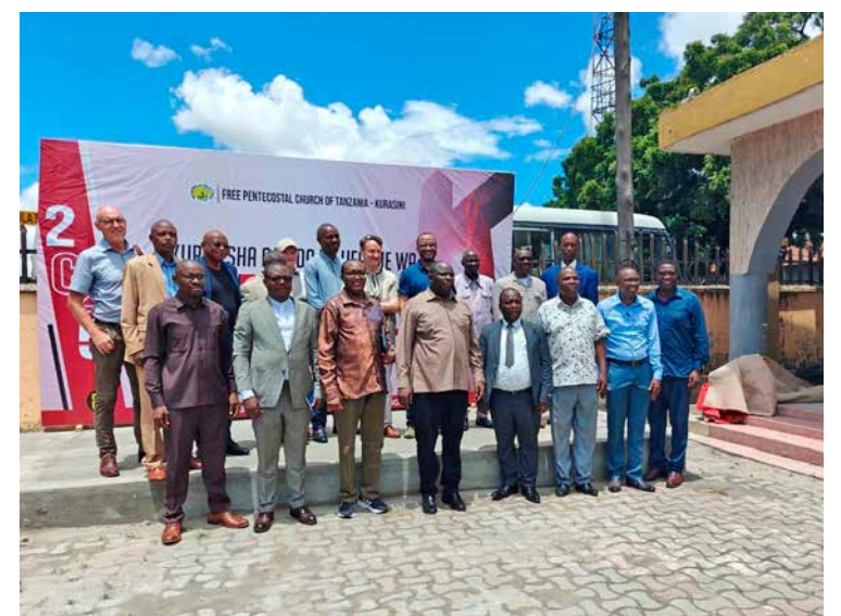
Eri maiden seurakuntien johtajat kokoontuivat aiemmin tänä vuonna Dar es Salaamiin neuvottelemaan Kongon tilanteesta ja julistamaan yhteistä rauhan tahtotilaa. Usko takarivissä.