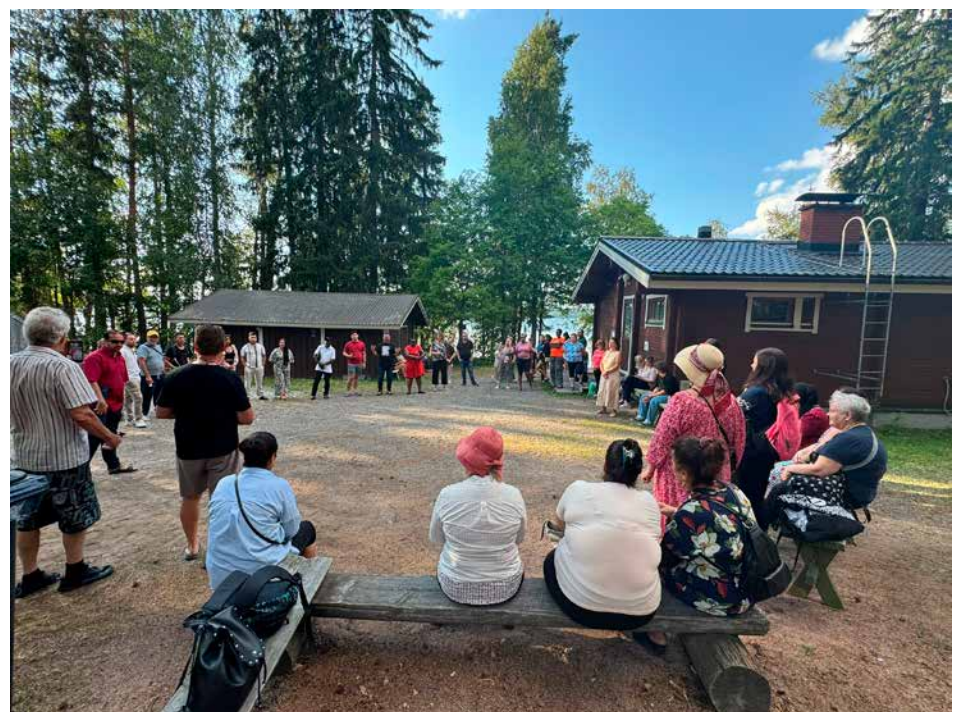
Monikulttuuriset mökki-illat Pirkkalan Pihlajaniemessä.