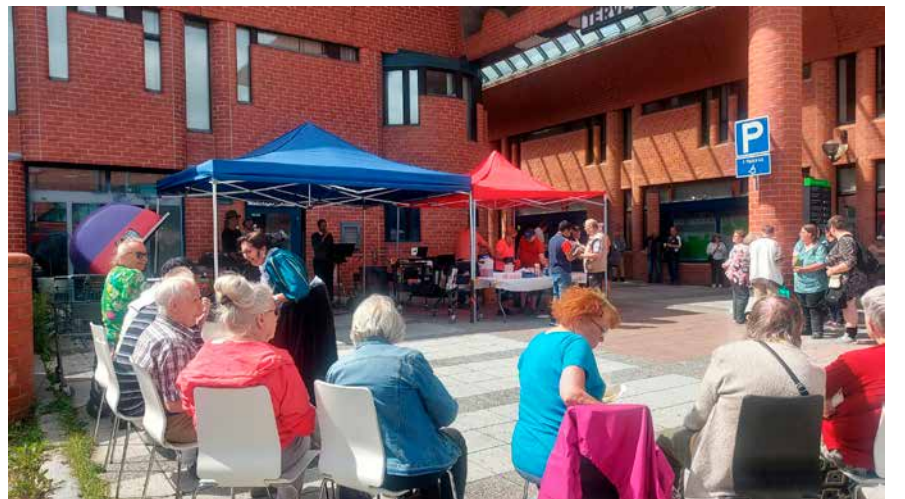
Ratikkapysäkin viereen muodostuu usein ”torikokous”.