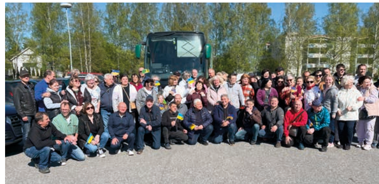
Majoittajat saattamassa vieraitaan kotimatkalle.

Tarja Jääskeläinen