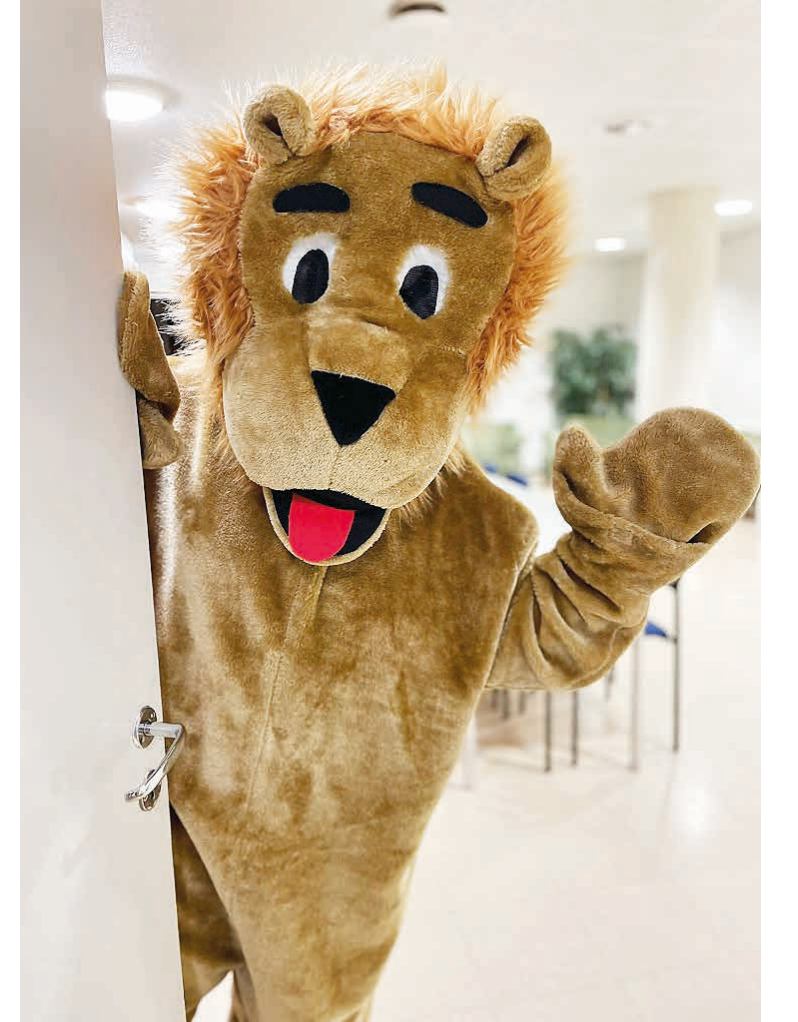
Jellona saattaa lapset Skidijumikseen. Jellona on monelle lapselle tärkeä ja yksi syy tulla mukaan.