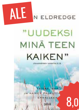
"Uudeksi minä teen kaiken" John Eldredge