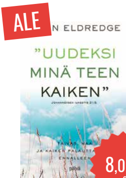
”Uudeksi minä teen kaiken” John Eldredge