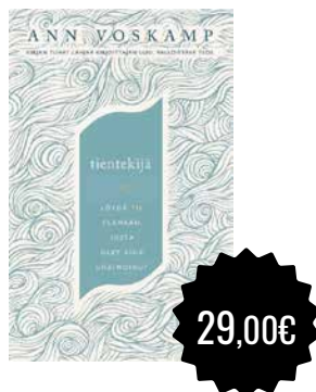
Tientekijä – Löydä tie elämään, josta olet aina unelmoinut Ann Voskamp