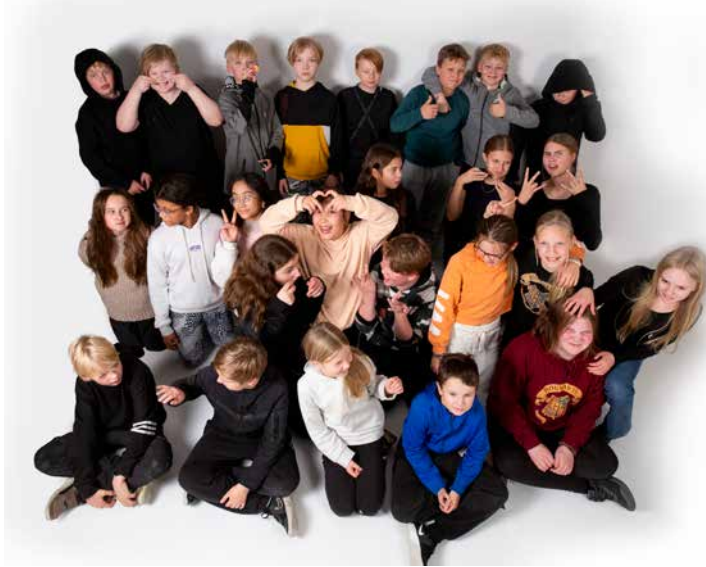
Wartit syksyn retkellä

hoot-tietovisalla. Jokainen ilta sisältää jonkun kivan leikin tai pelin, jonka avulla tutustumme toisiimme lisää. Aloitushetken jälkeen on erilaisia toimintaryhmiä, joissa toteutetaan varhaisnuorten omia toiveita. Tänä syksynä on muun muassa pelattu kaupunkisotaa, rakennettu legoilla, lakattu kynsiä, leivottu pullia ja leikitty pimeäpiilosta. Lopuksi syödään keittiöryhmän valmistamia tarjottavia ja keräännytään vielä yhteiseen loppuhetkeen.