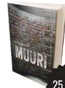
Muuri Outi Lepistö