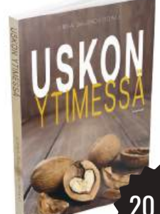
Uskon ytimessä Jukka Salonen (toim.)